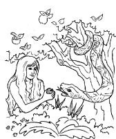
EVA – prva žena