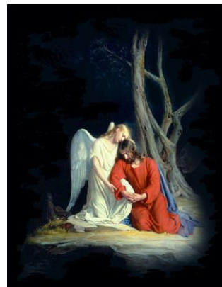
A ukaza Mu se anđeo s neba koji Ga ohrabri